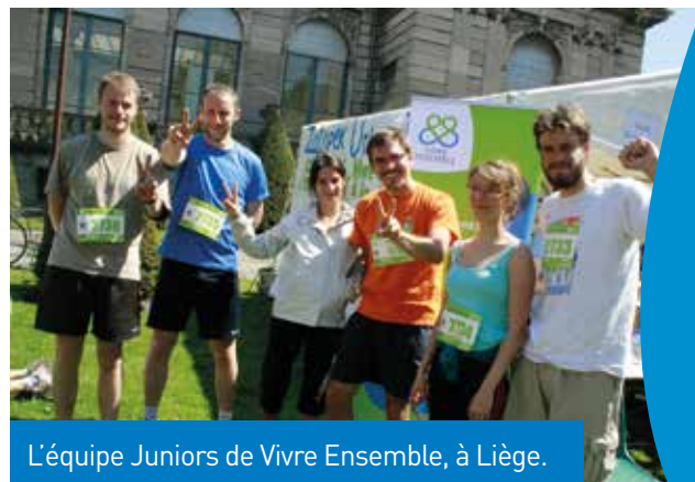
L'équipe Juniors de Vivre Ensemble, à Liège.