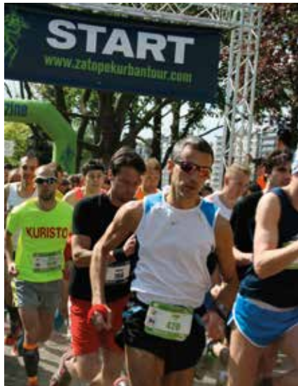
La course s'élançait. Plus de 2000 coureurs ! Parmi eux, 17 coureurs sous les couleurs de Vivre Ensemble.

que, par exemple, profiter des parcours qui étaient tout simplement superbes : à Charleroi, une grande partie de l'épreuve se déroulait sur le territoire de Marcinelle. De larges portions boisées succédaient à de bucoliques chemins de traverse qu'on ne soupçonnait pas nécessairement dans le Pays Noir. Un grand moment fut la traversée du site du charbonnage du Bois du Cazier,